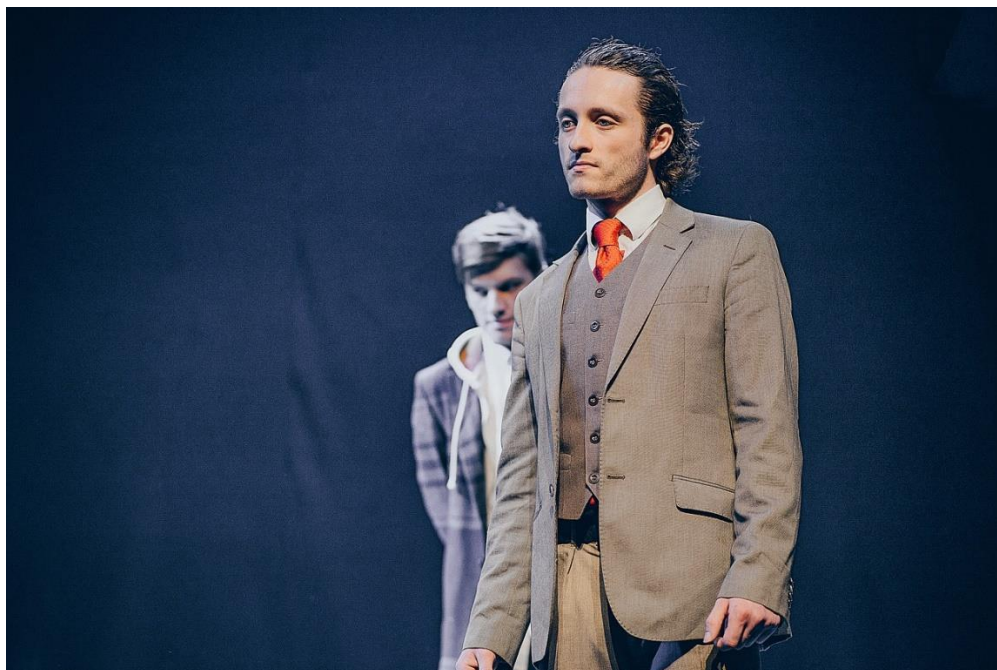
Фото с предпремьерного прогона спектакля: