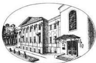
Литературный институт 1933

Молодёжный научно-практический форум проводится при поддержке Гётевской комиссии при научном совете РАН «История мировой культуры», кафедры перевода Литературного института им. А. М. Горького, Высшей школы сценических искусств, лаборатории сравнительного литературоведения и креативных практик Московского государственного лингвистического университета и при информационной поддержке «Литературной газеты».